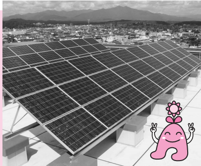
太陽光パネル(アルヴェ)

市では、地球温暖化の防止などのため、住宅用太陽光発電システムを設置するかたへの補助制度を創設しました(先着約70件)。国・県の同様の補助制度と併用できますので、この機会にぜひ設置してみませんか。