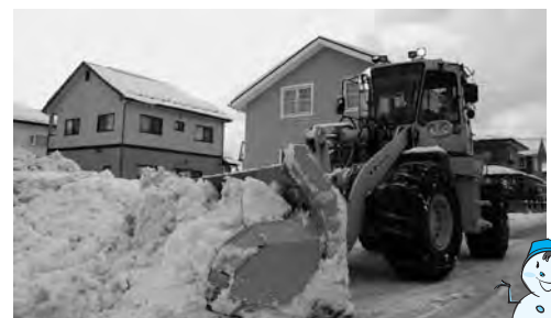
除排雪稼働日数は昨冬を5日上回る54日