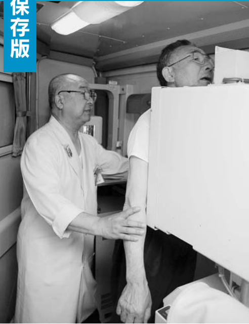
検診車内でエックス線撮影

肺がんや肺結核などを早期に発見し、治療に結びつけるための検診です。症状がなくても年1回は検査を受けて自分の健康を確認しましょう。14~15ページの日程で検診車が巡回します。どの会場でも受診できますので、16ページの受診票を持って都合が良い会場でどうぞ。検診結果は約6週間後に本人へ郵送します。