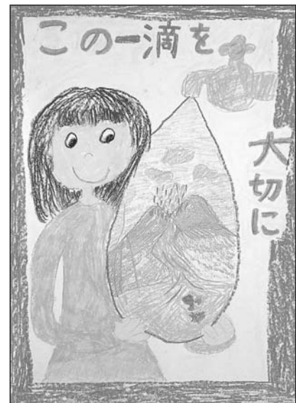
平成23年度最優秀賞作品

毎日使う水について関心を持ち、水道や下水道に対する理解を深めていただくため、「水に関するポスター」を募集します。