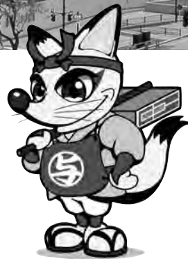
与次郎・エリアなかいちキャラクター

中心市街地活性化の拠点“エリアなかいち”がいよいよオープン！ 商業棟は7月5日から、秋田市にぎわい交流館AU(あう)、新・秋田県立美術館は7月21日(土)から営業開始。オープンを記念して、21日(土)・22日(日)は楽しいイベントが盛りだくさん！ みんなで来てネ！