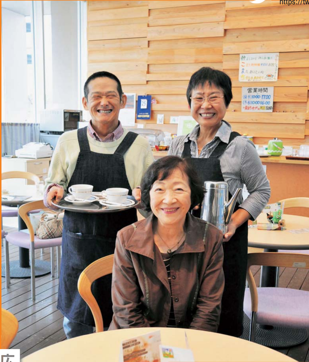
コーヒーに笑顔添えて(仲小路の喫茶店仲こまちにて)