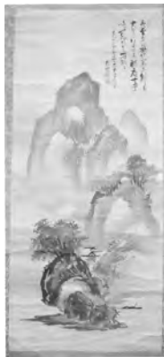
山水図 (佐竹義和筆)