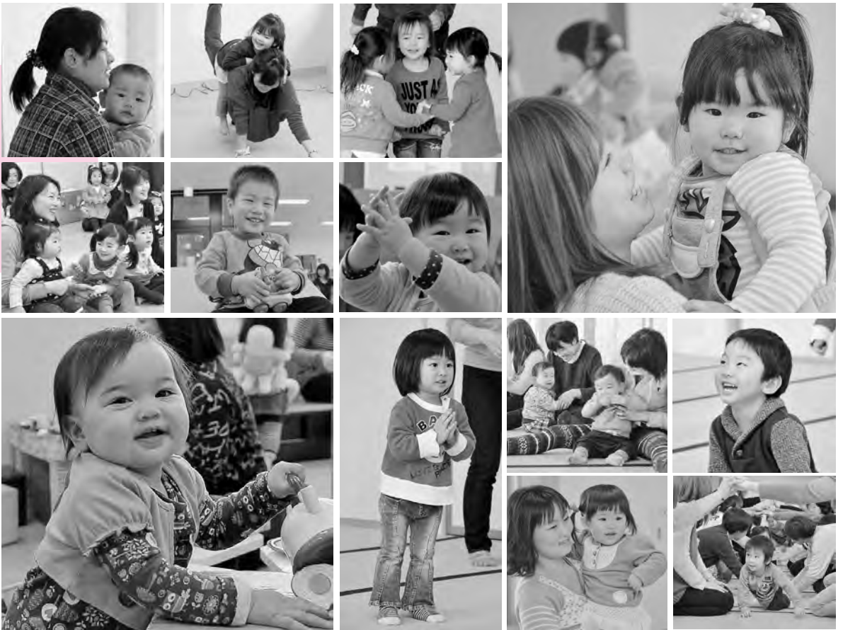
西部子育て交流ひろばの“バナナるーむ”(2月20日)、雄和子育て交流ひろばの“親子フィットネス”(2月22日)、河辺市民サービスセンターの“ひなたぼっ子”(2月26日)におじゃましました。