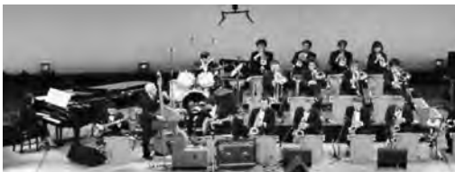
ブルーヴィン・ハード・ジャズ・オーケストラ