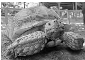
ゆっくり、確実にネ