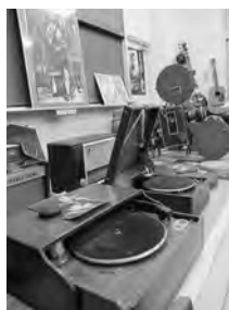
油谷これくしょん