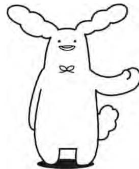
大森山動物園の イメージキャラクター 「オモリン」