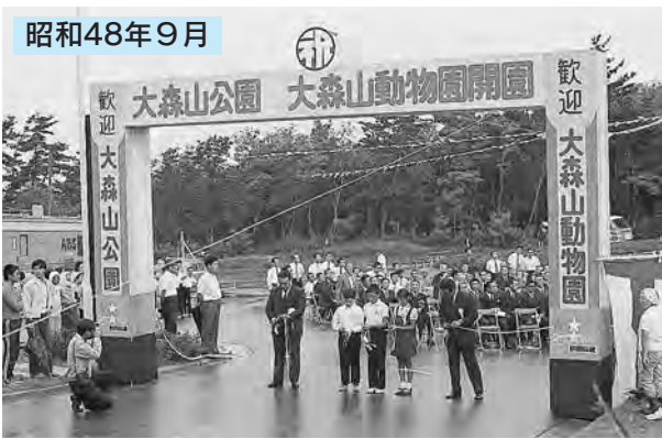
開園オープニング式典で