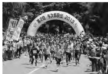
7月21日、第2回与次郎駅伝…今年約40年振りに、広小路を通行止めにして行われ、千人を超えるランナーが駆け抜けました。