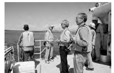
7月16日、海の施設見学会…秋田港湾事務所の「あきかぜ」に乗船してもらい、秋田港内を約1時間ほど見学しました。