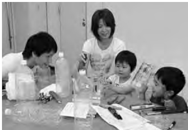
思ったよりも簡単でした!

7月13日、にぎわい交流館で、「森と動物の音楽祭(左ページ参照)の会場と動物園をつなぐ通路をライトアップするランタンづくりを行いました。ボランティアの大学生と参加者が、ペットボトルを材料に約150個を制作。当日の幻想的な風景が今から楽しみです。