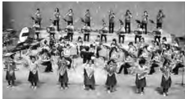
御所野学院中・高校

わらび座によるアトラクションと、小中高のブラスの響き(日新小学校、秋田西中学校、御所野学院中・高校)