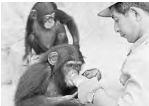
ポンタもまだ赤ちゃん