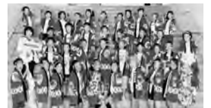
Crab ひろおもて(ヤートセ)