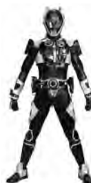
ビートファイターACE