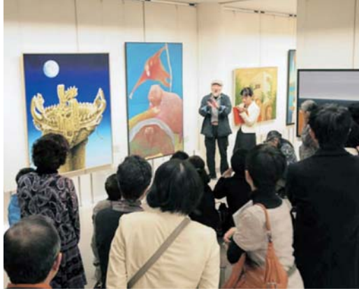
それぞれの「風土」を感じる作品、今から楽しみです!