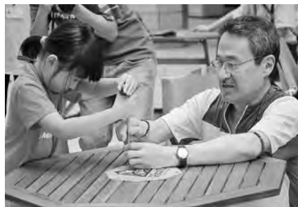
先生の指導で上手にできました