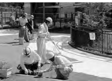
塗装作業、お疲れ様でした

今回は、ゾウとキリンの展示場付近の通路に遮熱塗装(写真の白い部分)を施工。これにより、夏の体感温度を10度〜15度程抑える効果があるそうです。まだまだ暑い日が続くこの季節にはうれしい心配り。みなさんも、ぜひ園内で実感してみてください。