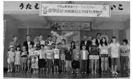
ハッピーバースデー、オモリン♪

開園40周年を記念して美術工芸短大の学生がデザインした、大森山動物園のイメージキャラクター「オモリン」がいよいよ動物園にやってきました。