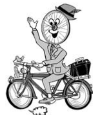
ナイスライダーくん

環境にやさしい自転車通勤を応援する取り組み“Bike to Work”の一環で、5月30日(金)7:30～8:30、千秋公園内大手門堀東側ポケットパークに自転車立ち寄れる休憩所「バイカーズオアシス」を設置します。無料で飲み物や啓発グッズを差し上げます。ぜひ立ち寄りください。環境総務課☎(863)6862