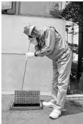
* 音聴棒という機器で、振動音を聴きながら漏水の有無を確認します。