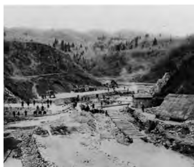
藤倉水源地の工事風景(明治36年ごろ)。完工した明治44年当時の秋田市の人口は約35,000人、給水戸数は約5,000戸でした

秋田市の水道発祥の地である藤倉水源地(山内地区)は、明治40年に一部通水を開始し、昭和48年に取水を停止するまでの70年近く、市民生活に潤いをもたらしました。日本の近代水道の遺構として極めて保存状態が良かったことなどから、平成5年には、近代化遺産として初めて国の建造物の重要文化財にも指定されています。水道施設としての役割は終えましたが、いままも太平山から流れ出る豊富な水を受け止めています。その流れ落ちる水しぶきと、周囲の新緑とのコントラストはこの季節ならではの。旭川上流に少し足を伸ばして、散策に訪れてみてはいかがでしょうか。