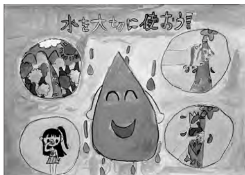
平成25年度最優秀賞作品

毎日使う水について関心を持って、水道や下水道に対する理解を深めてもらうため、市内の小学生を対象に、「水」に関するポスターを募集します。ぜひ応募ください！