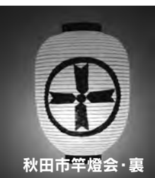
秋田市竿燈会・裏