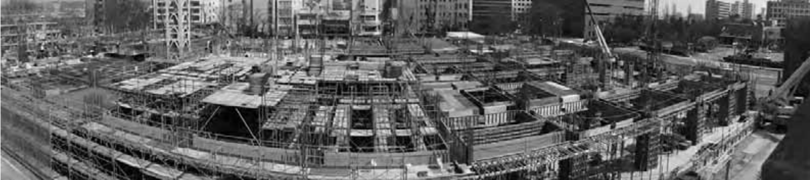
新庁舎の工事風景(3月31日、パノラマ撮影)。本体の完成は来年3月の予定です