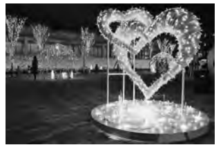
エリアなかいちで