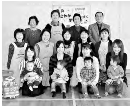
地域の人々で子育てを応援します