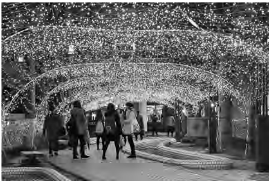
光のトンネル♪ ウツキウキ♪ (秋田駅西口)

イ ルミネーションが中心市街地を彩る季節。今年も、エリアなかいちや広小路、仲小路のほか、秋田駅西口周辺も含めた、「あきた光のファンタジー」が冬のにぎわいを演出しています。各所に飾られたハートのオブジェや光のトンネルを見ているだけで、なんだかワクワクしてきます。これから本格的な寒さがやってきますが、ほっこりする、夜の散策もたまにはいかが？