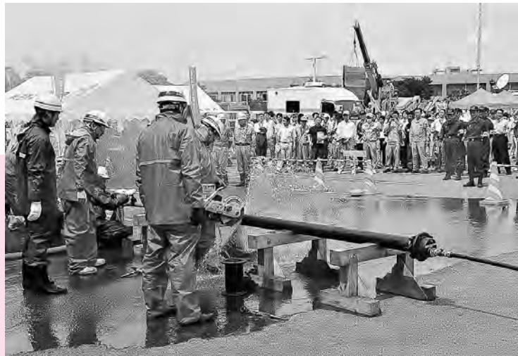
昨年の秋田市総合防災訓練で行われた、水道管などの復旧工事のデモンストレーション