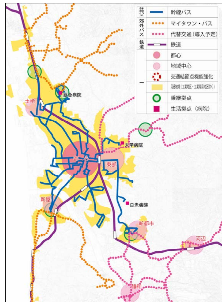
※支線バスの表示は数が多いため省略