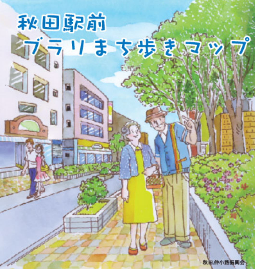
秋田仲小路画賛会