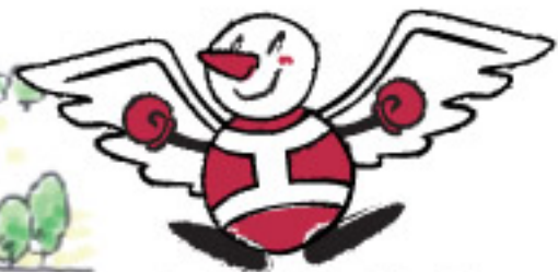
秋田駅前ガイド：ナッキー君