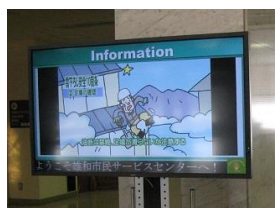
「雪下ろし安全10箇条 動く電子ポスター」

秋田市消防本部ホームページURL: http://www.city.akita.akita.jp/city/fr/