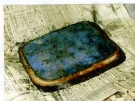
『石井露月日記』焚傷原本

露月会には文庫の管理と、忌米鬼の追善供養と、女米鬼の追善供養と、し米鬼の追善供養と、