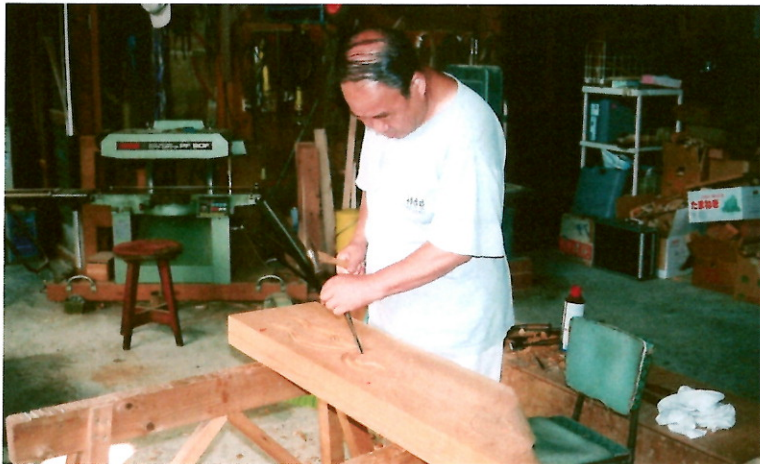
平成23年春の叙勲 瑞宝単光章(職業訓練功労)