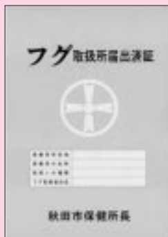
フグ取扱所届出済証

フグがおいしい季節です。でも、フグは正しく調理しないで食べると食中毒を起こし、ときには死に至ることも…。釣ったフグやもらったフグを素人判断で調理するのは絶対にやめましょう。