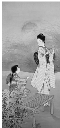
寺崎廣業「月下少女」(明治30年ころ)

平成16年度から19年度までの購入・寄贈コレクションを一堂で紹介。小田野直武、平福百穂、寺崎廣業、池田淑人、馬場彬など、秋田ゆかりの作家たちの作品をお楽しみください。