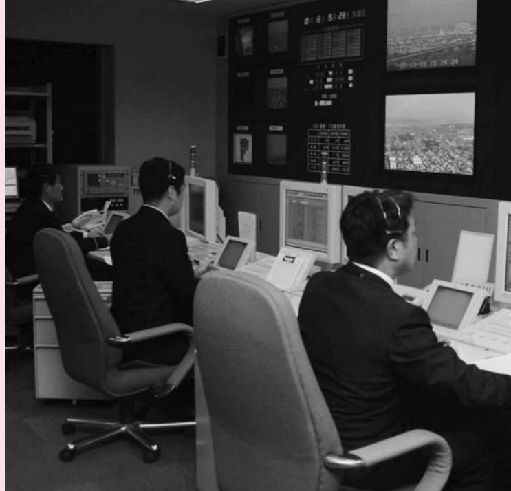
消防本部指令室は24時間体制で通報に対応しています