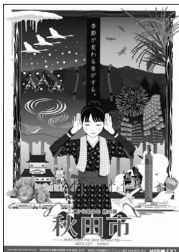
作品名「季節が変わる音がする。」 -ここから始まる旅の扉 秋田市-

自殺予防などをテーマにNPO法人蜘蛛の糸のメンバーなどが出前講演を行います。10人以上が参加する会合、研修会などが対象です。講演時間は1時間程度。会場はご相談ください。無料。申し込みは、NPO法人蜘蛛の糸へどうぞ。☎(853)9759