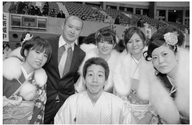
新しい門出をみんなで祝おう！(前回のつどいで)