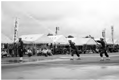
小型ポンプ操法の部優勝の浜田分団