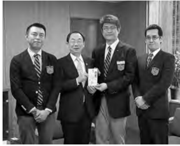
2月9日に行った贈呈式で。同会秋田支部からは毎年寄付をいただいています

秋田市の福祉に役立ててほしいと、日本バーテンダー協会秋田支部から、昨年11月に開催した「第29回NBA秋田チャリティーカクテルパーティー」の収益金の一部5万円を、寄付していただきました。 福祉総務課 ☎(888)5657