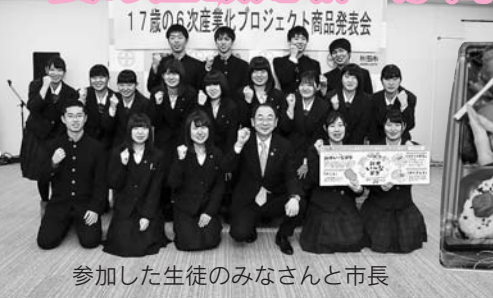
参加した生徒のみなさんと市長