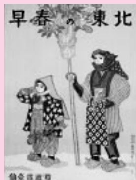
ポスター「早春の東北」昭和11年作

赤れんが郷土館は展示替えのため11月13日(月)から17日(金)まで一時休館します。また、新館3階にある「勝平得之記念館」は改修作業のため11月13日(月)から来年1月5日(金)まで休室します。 問い合わせ 赤れんが郷土館 ☎(864)6851