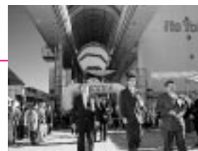
12月2日 大屋根開通式で