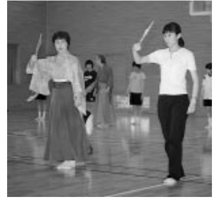
中高一貫の教育を実践する御所野学院。「能」を学ぶ総合学習の時間もあります