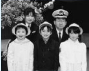
黄色い帽子贈呈式で