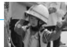
消防と子どものつどいで