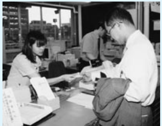
夜間の窓口もどうぞご利用ください