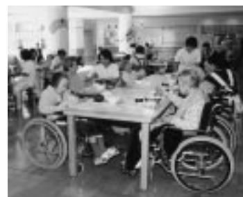
御所野のけやき会で

介護サービスを利用しているかたで市民税非課税の老齢福祉年金受給者などのかたは、社会福祉法人でサービスを受ける際、1割の利用者負担額などが通常の半額になる制度があります。