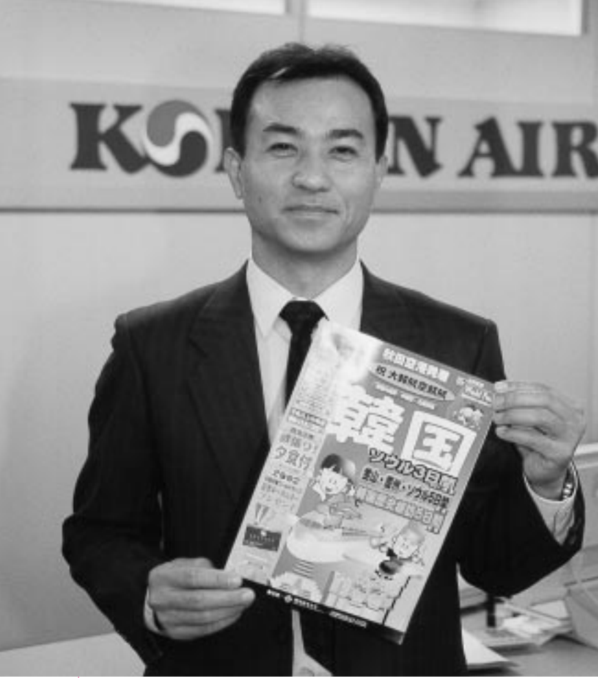
観光にビジネスに…。秋田のこれからにお手伝いしたいですね