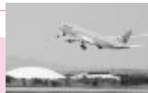
秋田～韓国便ダイヤ

例えばパリ…(日付変更の関係でその日のうちに) 秋田発(火曜日)9:50 仁川空港着12:30 空港発13:30 (11時間) パリ着17:30