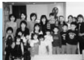
ハッピーマザーのみなさん