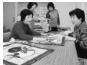
パッチワーク教室