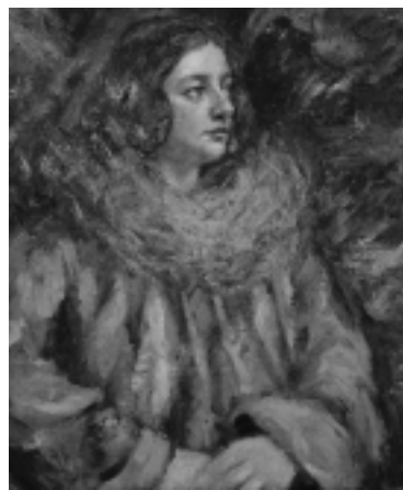
「赤衣着物の女」 小西正太郎 1924年作