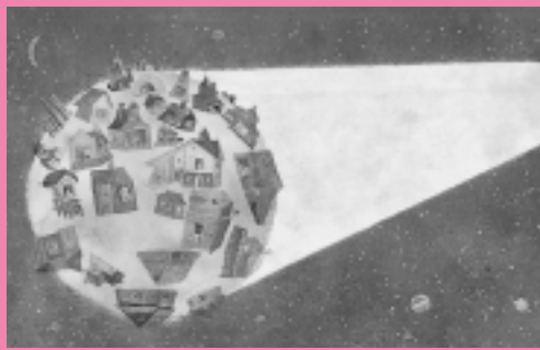
「お月さまと王女」1991年

画業40年を迎えたワイルドスミスの絵本の原画作品をストーリーやキャラクターの性格ごとに「ことば」「どうぶつ」「ゆめの国」「ぼっけんの国」などに分けて紹介します。