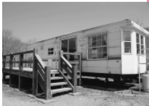
トレーラーハウス