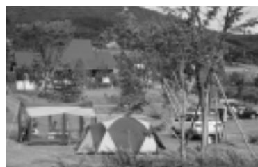
オートキャンプ場