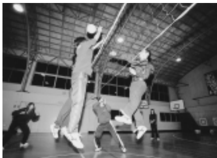
牛島小学校では、牛島バレー愛好会のみなさんが活動していました