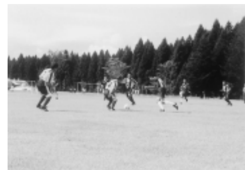
スポパークかわべ