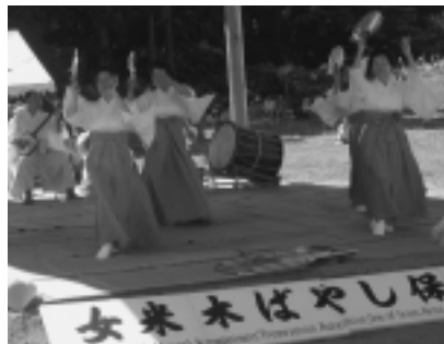
町指定無形文化財・めめきばやし (雄和町)

河辺町の県指定史跡豊島館、雄和町郷土資料室の管理と公開は現行どおりとします。現在休館中の雄和町ふるさとセンターは、合併後に活用を検討します。