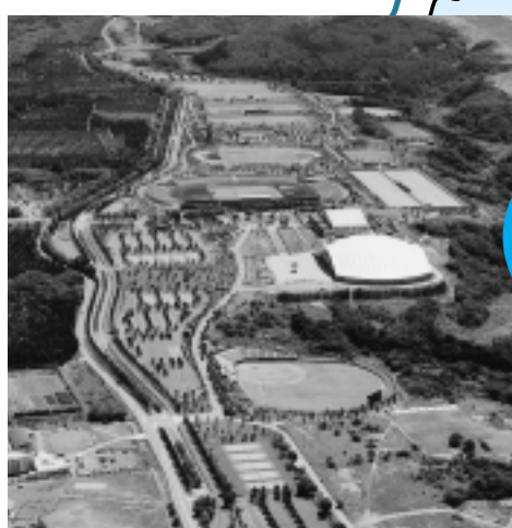
県立中央公園 スポーツゾーン