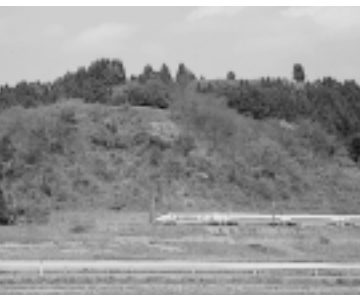
県指定史跡・とよしまだて豊島館城跡 (河辺町)