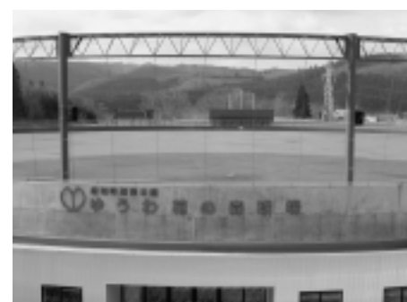
花の森運動公園 ...花の森球場 花の森テニスコート