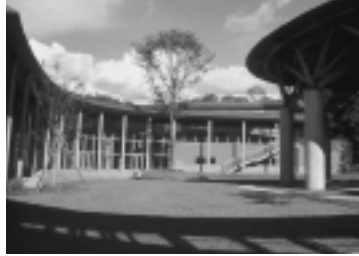
仁別の「まんたらめ」