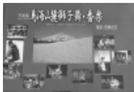
「鳥海山麓獅子舞・番楽」

秋田・山形両県にわたる鳥海山麓10町に370余年前から伝わる獅子舞と番楽を、10年間撮影し続けて出版した写真集「鳥海山麓獅子舞・番楽」が、秋田県民俗学の貴重な記録となりました。