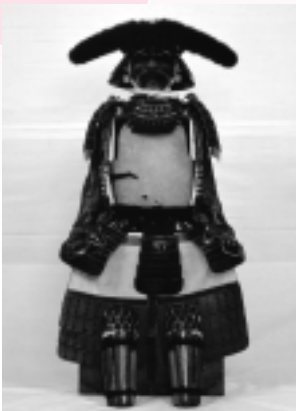
人色皮包 ：佐竹史料館蔵

時間：午前9時～午後4時30分 観覧料 一般100円 高校生50円 中学生以下無料