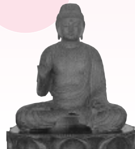
銅造阿彌陀如来坐像 ：全良寺蔵国指定重要文化財

時間：午前10時～午後6時(入館は5時30分まで) 観覧料 一般400円 高・大学生250円 中学生以下無料