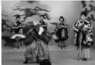
県指定無形民俗文化財「秋田万歳」