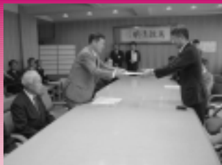
寺田知事に合併申請書を提出