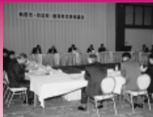
任意・法定協議会はあわせて15回開催