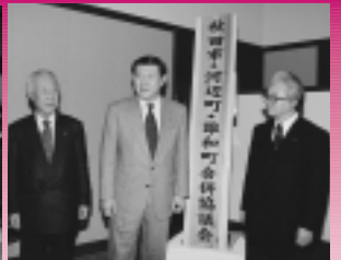
任意合併協議会を設置

合併記念式典 午後3時〜 アルヴェエ1階きらめき広場 河辺・雄和市民センター 開所式 河辺市民センター（現河辺町役場） 午前9時〜 雄和市民センター（現雄和町役場） 午前10時45分〜