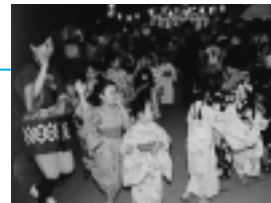
大住フェスティバル