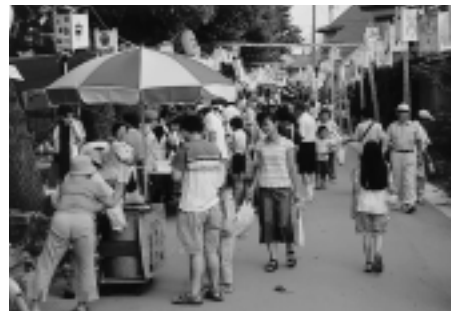
夏祭りでのぎわった散策道