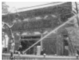
天徳寺での防火訓練の様子

秋田市には、貴重な文化財がたくさんあります。市民の財産である文化財を火災・地震などの災害からみんなで守り、後世に受け継いでいきましょう。文化振興室tel(866)2246