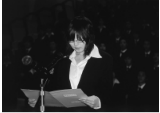
3月24日、秋田テルサで行われた合同入社式で。今年も多くの若者たちが、社会人に仲間入りしました。