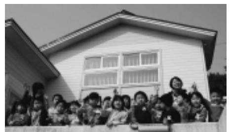
新しい保育園で、元気いっぱい育ちます

く、すぐに仲良し。これからも園舎のシンボル三角屋根の下からは、明るい元気な声が聞こえます。