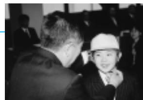
黄色い帽子贈呈式で