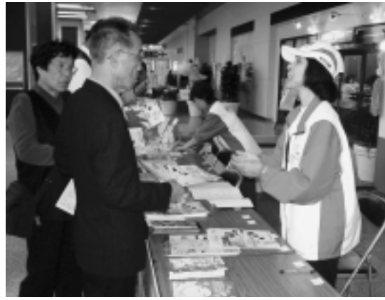
兵庫のじぎく国体で会場を案内する市民ボランティア(右)

秋田わか杉国体秋田市実行委員会事務局 tel(866)2830・ファクス(866)1790 Eメール ro-gnna@city.akita.akita.jp