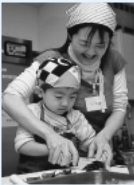
アルヴェのキッズ・クッキング