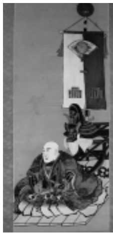
八幡秋田神社から寄託され、初公開となる「芳楊軒阿澄(佐竹義継)肖像画」

平成17・18年度に、寄贈・寄託を受けた資料や、購入した資料を中心に、秋田藩の歴史の一端を紹介しています。佐竹史料館tel(832)7892