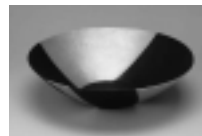
接合せ(はぎあわせ)

県内唯一の人間国宝、鍛金家・関谷四郎。「接合せ」(異なる金属を接合させる技法)と呼ばれる技で作られた作品など、卓越した鍛金技術と金属工芸の美をご堪能ください。