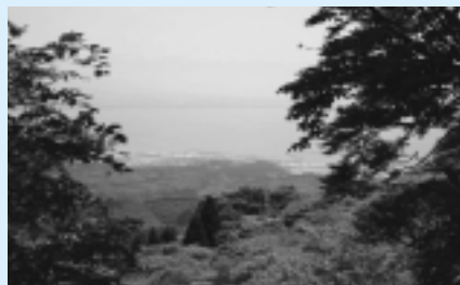
真山山頂からの眺め